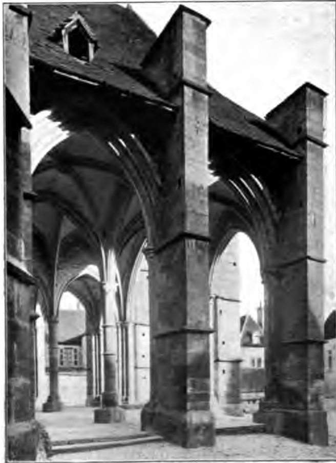
Cliche des Monuments historiques.

gros piliers, auxquels sont adossés des pilastres cannelés, remplacent les colonnes, et, autour du chœur, se déroule un bandeau décoré de fines rosaces. Ces formes accusées, ces motifs de décoration antiques font un bel effet; mais du dehors, Notre-Dame ne produit pas une moins